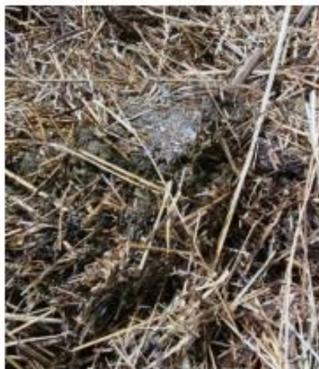
Vervuild, rot voer aan de linkerkzijde van de voergang.

Aan de rechterzijde was de ligboxenafdeling voor de koeien.