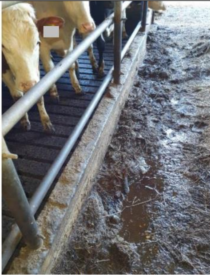
Zeer natte, rotte en vuile laag graskuil als "voer" beschikbaar voor de runderen in stal 2.5-2.6-2.7.