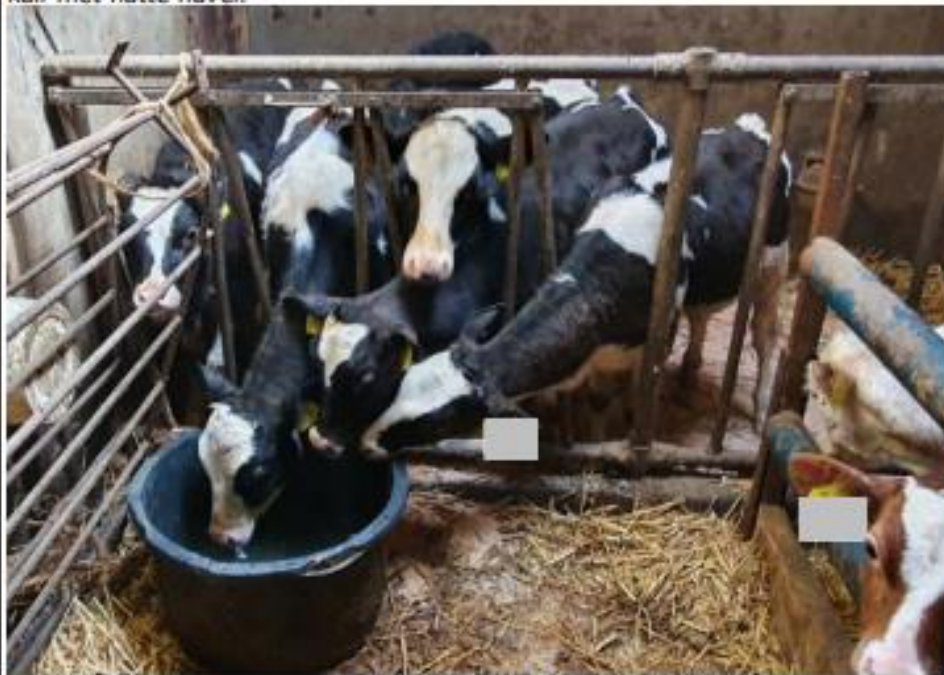
Kalverhok stal 1, linker hok met 6 zeer dorstige kalveren.