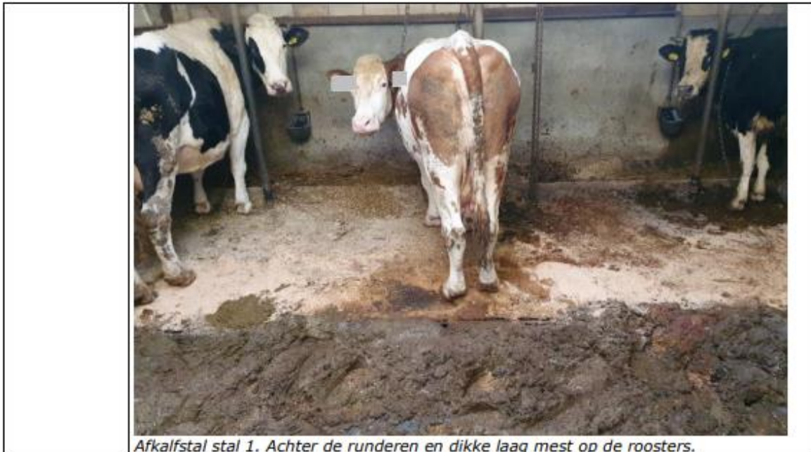
Afkalfstal stal 1. Achter de runderen en dikke laag mest op de roosters.