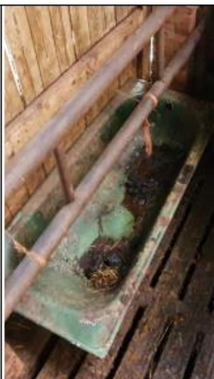
Hok 1 links, ligboxenstal, lege en vuile waterbak.