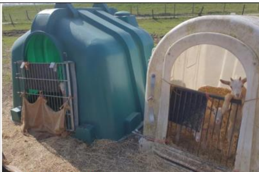
Wei met 2 iglo's met geitenlammeren.

Op het erf startten wij de controle bij de hokken tussen stal 1 (ligboxenstal) en stal 2.