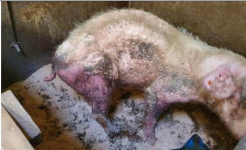
Kalverhok stal 1. Ziek, kreupel, pijn lijdend en zeer mager varken.

In stal 1 trof ik een grote groep ernstig tot zeer ernstig kreupele runderen aan. De veehouders vertelden dat de klauwbekapper geblesseerd was en dat ze geen andere hadden. Voor het welzijn van de runderen is het noodzakelijk dat de veehouders proactief handelen. Dat betekent dus onder andere tijdig klauwbekappen en zo nodig zoeken naar een vervanger van de vaste klauwbekapper. Dit was echter niet gebeurd.