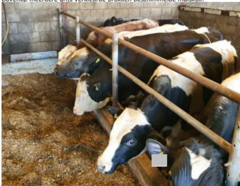
Ter hoogte van hok 2.4/2.3 donker verkleurd, rot voer op de voergang. Ook hier is de voerboom niet goed afgesteld voor het formaat runderen. De nekken worden door de metalenboom hard ingedrukt. Kale nekken en eeltvorming zijn zichtbaar bij diverse runderen op de foto. De huisvesting is niet aangepast aan het formaat van de runderen die er in gehouden worden.