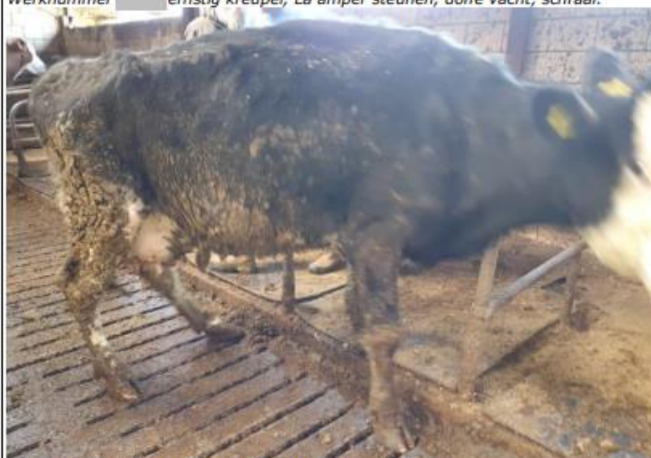
Zeer mager, extreem vuil rund, krommer rug, ernstig kreupel.

Naast foto's zijn er ook enkele filmpjes gemaakt van de ernstig kreupele runderen en het zieke varken. Deze zijn indien gewenst op te vragen.