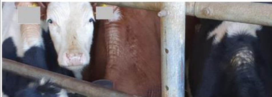
Drie runderen met kale nek/ schoft en eeltvorming. Ribbelige huid met microfissuren waardoor kiemen makkelijk toegang hebben.

De meeste runderen hier hadden meer of minder ernstige nek of schoftbulten door het verkeerd afgestelde voerhek met metalen voerbomen die de nek/ schoft van deze runderen beschadigden en tot potentieel ernstig letsel kunnen leiden. Daarnaast veroorzaakt dit ook ongerief en een onfysiologische houding tijdens het vreten.