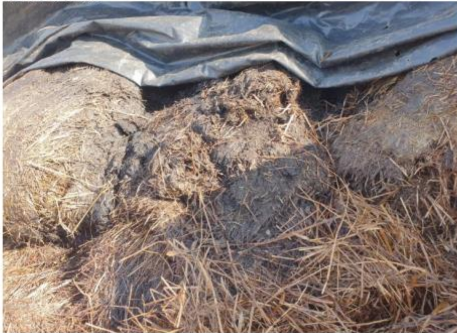
Zeer slechte graskuil. Nat, rotting geur en veel grondbijmenging. Niet diervoederwaardig. Dit materiaal lag op diverse plaatsen in stal 2 en 1 als "voer" voor de runderen.