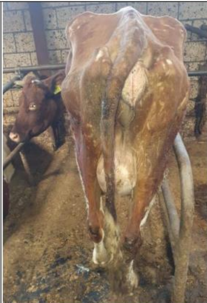
Werknummer [redacted] ernstig kreupel, La amper steunen, doffe vacht, schraal.