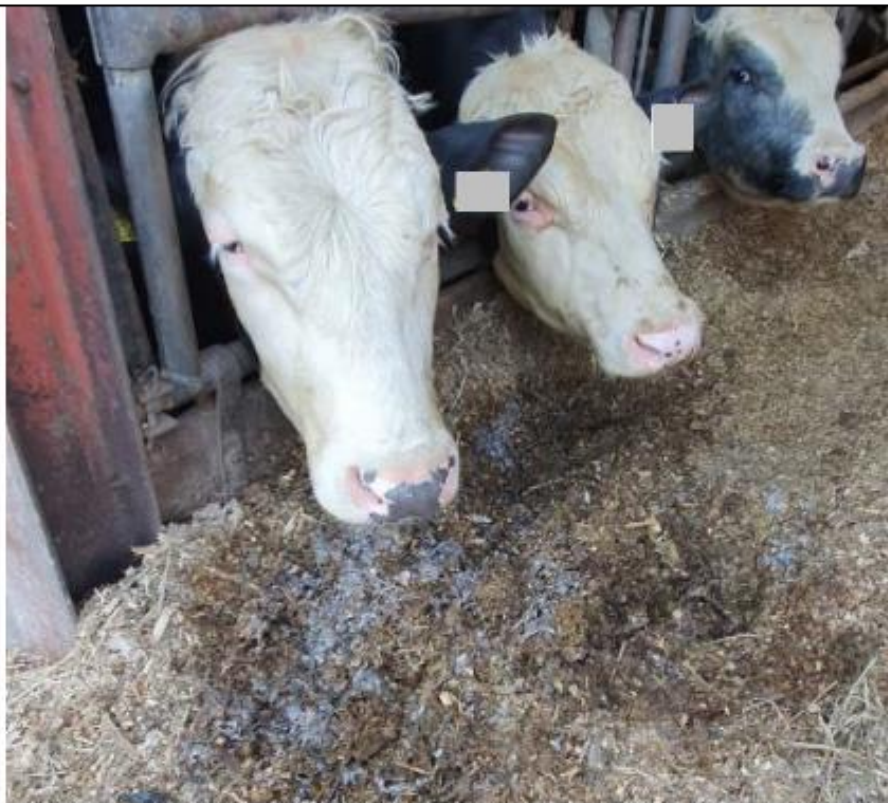
Ter hoogte van hok 2.1/2.2 maiskuil met er onder een donkere, rotte laag oud voer. Bovenop meerdere grijs verkleurde brokken beschimmelde maiskuil.