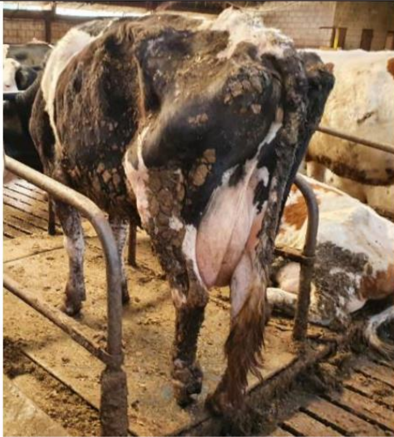
Extreem mager, zeer vuil rund met dikke mestklonten aan de vacht. Linksachter ernstig kreupel, amper meer steunend. Kromme rug en lege pens (dzw onvoldoende gegeten in de afgelopen 6 uur).