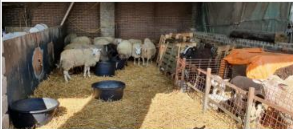
Groot hok met kleine hokjes schapen en lammeren.

Ik zag in de kleine veewagen 3 schapen met lammeren. Deze konden schoon en droog liggen en beschikten over voer. De emmer voor water was omgevallen en leeg. Deze schapen hadden niet de beschikking over water.