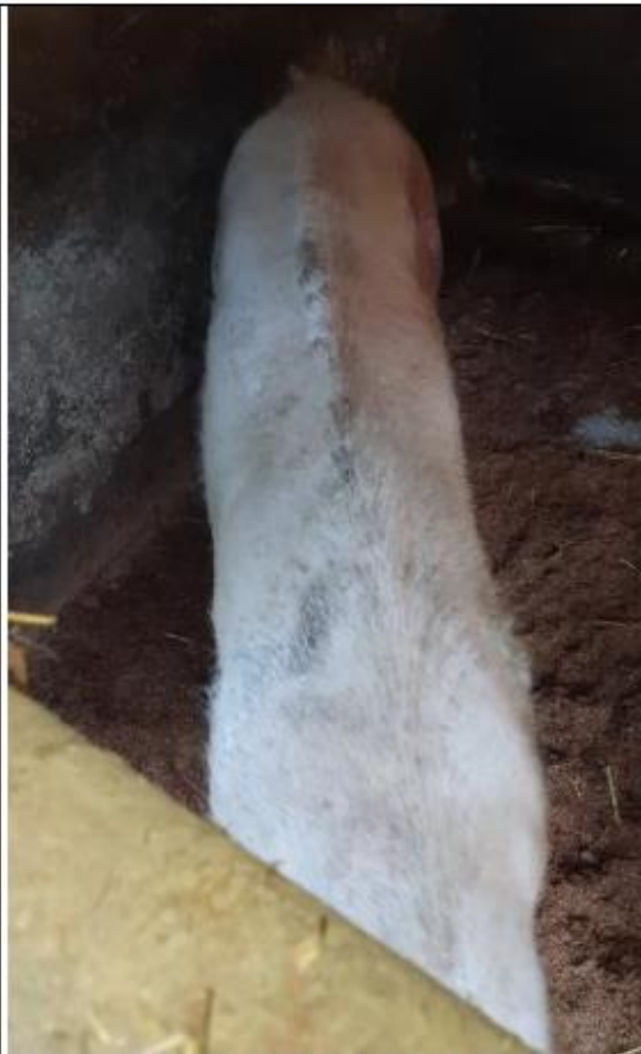
Schraal varken in hok 5 met ingevallen lijf en uitgesproken ruggengraat.

Stal 2 jongvee en stieren en kalverhok stal 1: