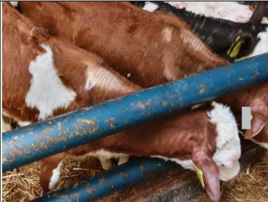
Kalverhok stal 1 tegenover de deur. Jonge kalveren met kaalgeschuurde nekken/schoften door verkeerd afgestelde voerboom.