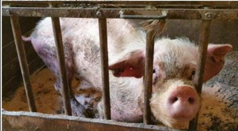
Kalverhok stal 1. Ziek, kreupel, pijn lijdend en zeer mager varken met kromme rug, doffe huid met lange haren en hangende oren.

Naast het kalverhok was er nog een zogenaamde "afkalfstal".