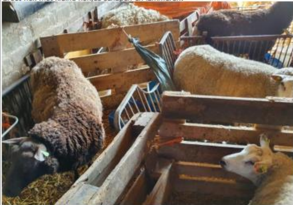
Kleine hokjes met per hok een ool en haar lammeren.