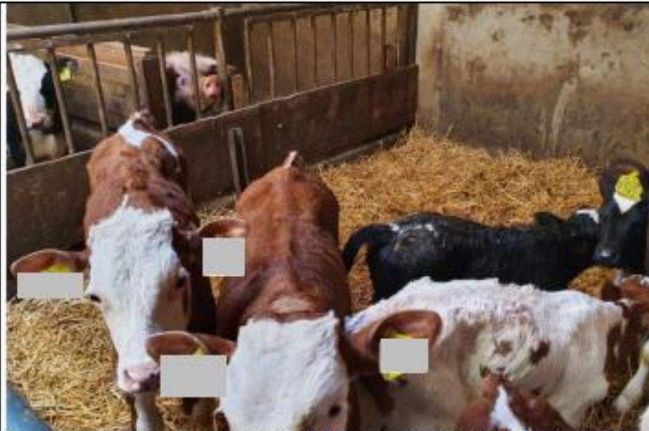
Kalverhok stal 1, overzicht van de drie hokken en centraal het pasgeboren zwarte kalf met natte navel.