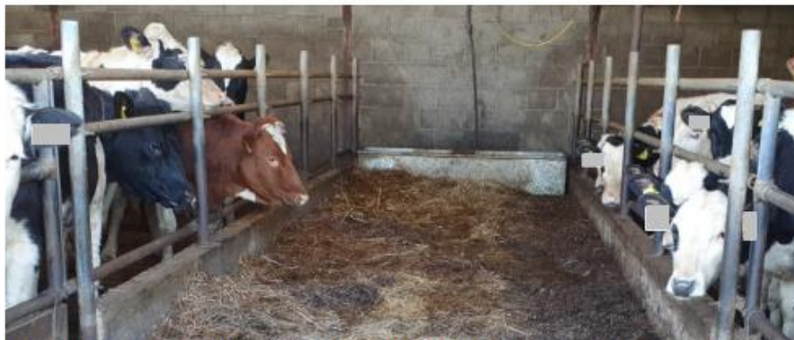
Vuile voergang en te laag afgestelde voerbomen stal 2, hok 2.5-2.6-2.7.

De 18 en 12 runderen die moesten vreten van betreffende voergang werden niet op een geschikte en hygiënische wijze gevoerd met voor de leeftijd en soort passend voedsel en de afstelling van de voerboom zorgde voor letsel en ongerief aan de nek/ schoft.