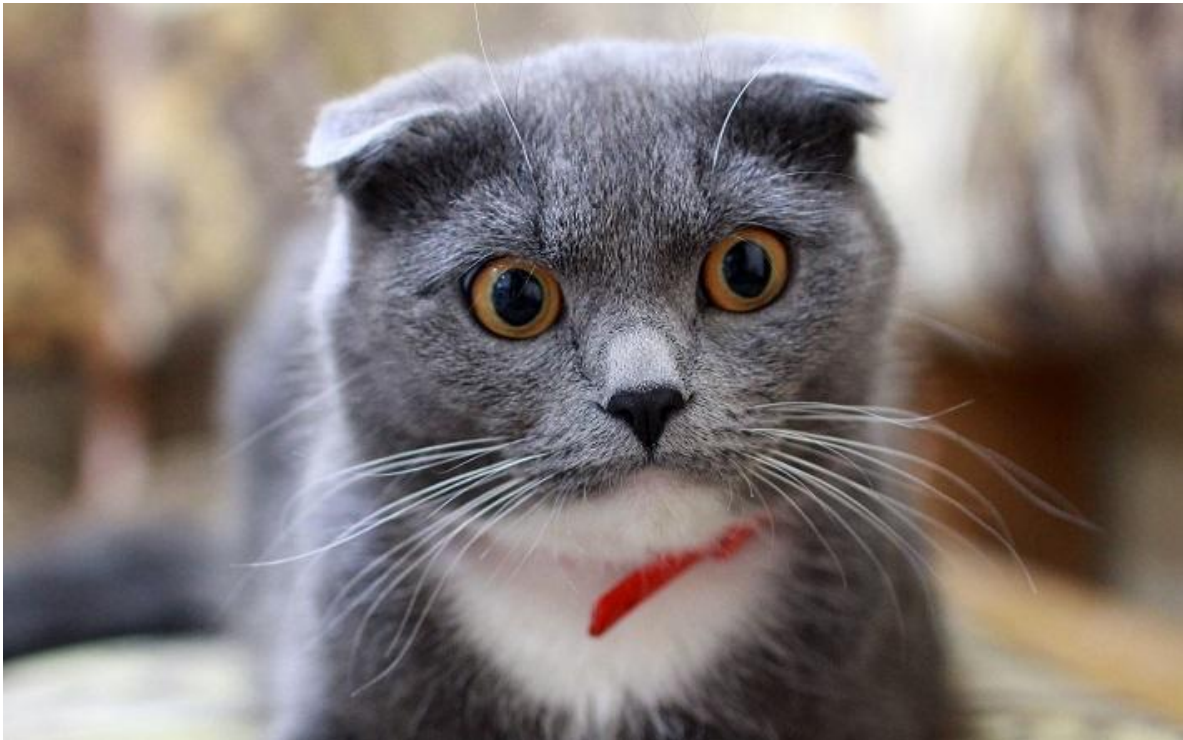
De gevouwen oren zorgen voor pijnlijke gewrichten.

Zijn platte snuitjes en gevouwen oortjes schattig? Helemaal niet toch, als deze kenmerken voor een huisdier dag en nacht ellende geven en voor de eigenaar veel zorg, verdriet en torenhoge kosten? Neem stelling, laat in uw media-uitingen zien dat u hier niet aan meedoet! Toon alleen honden en katten die gezond en gelukkig zijn.