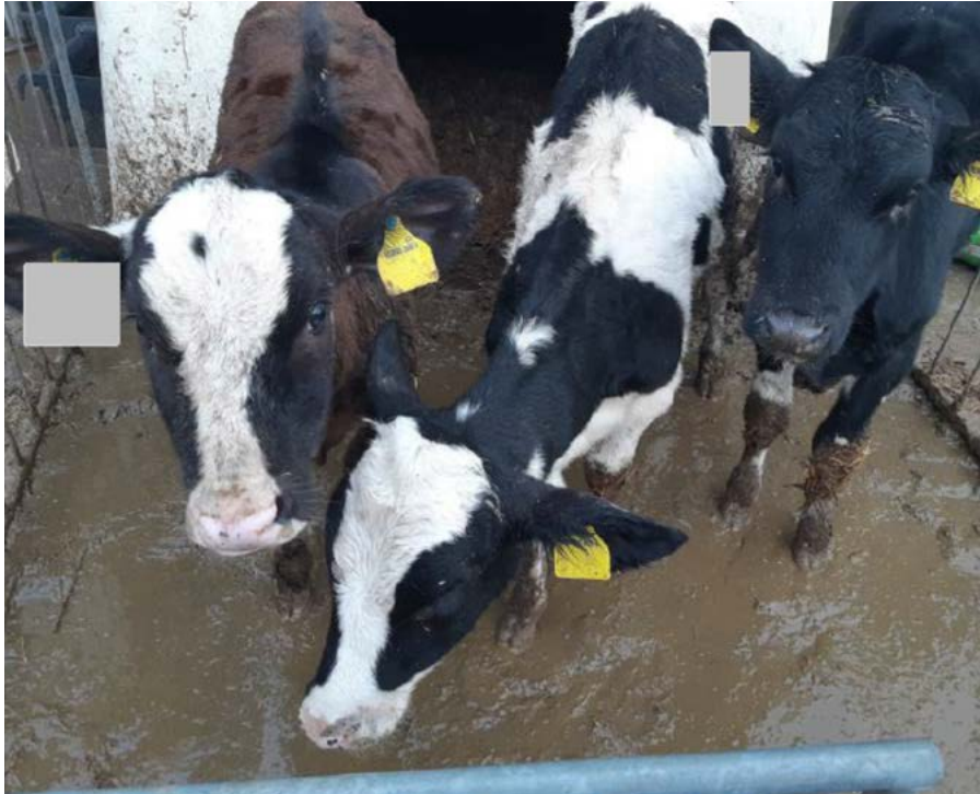
Bevuilde groepsiglo met vervuilde kalveren.