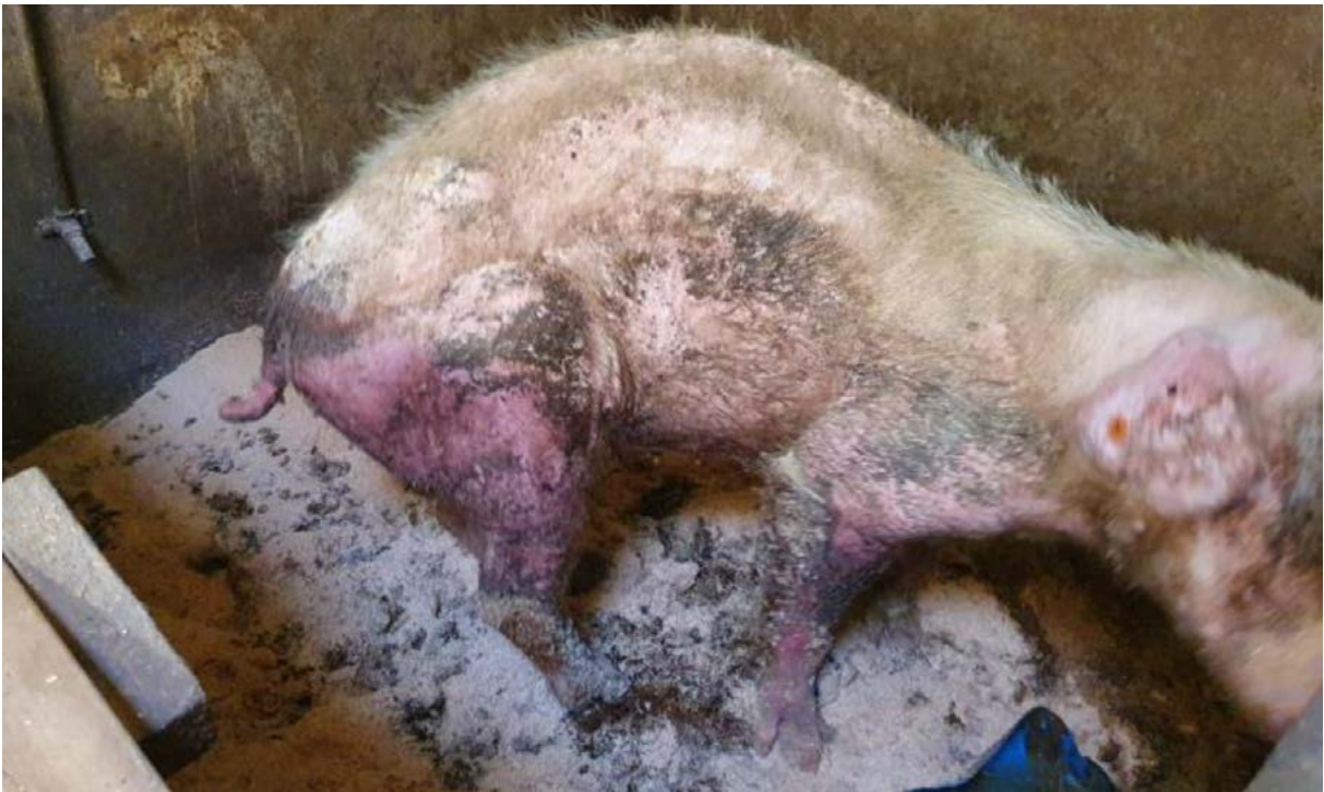
Kalverhok stal 1. Ziek, kreupel, pijn lijdend en zeer mager varken.