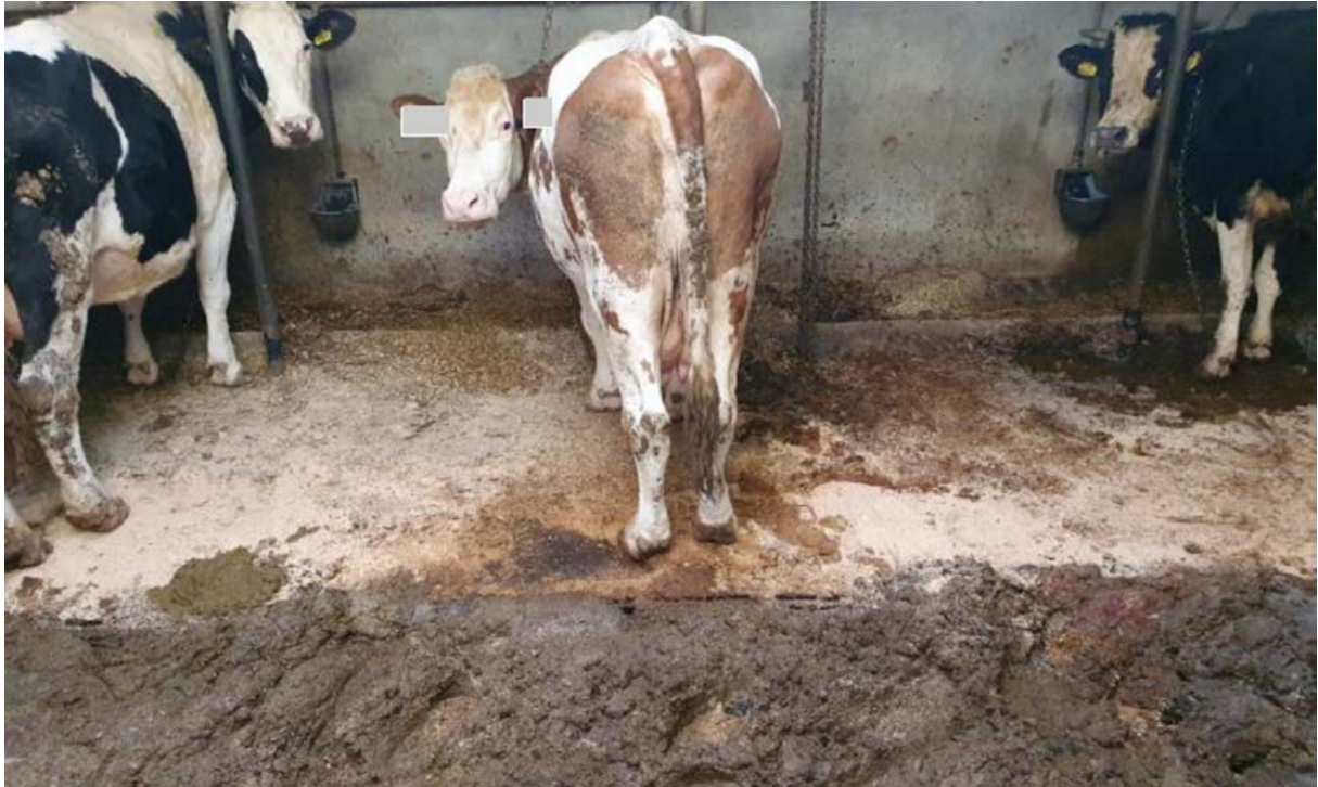
Afkalfstal stal 1. Achter de runderen en dikke laag mest op de roosters.