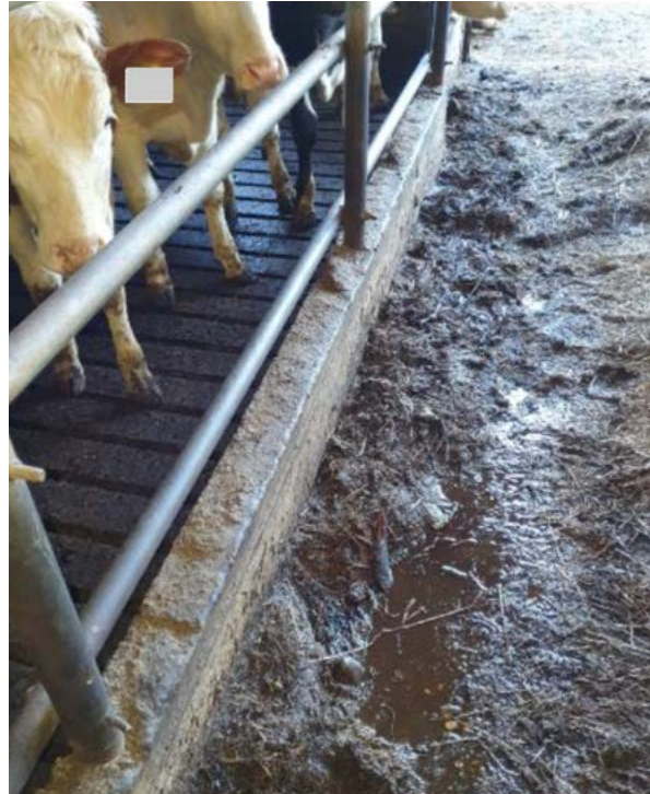
Zeer natte, rotte en vuile laag graskuil als "voer" beschikbaar voor de runderen in stal 2.5-2.6-2.7.