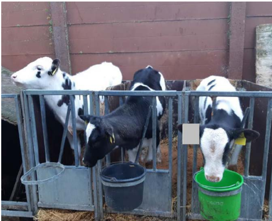
Kalveren ouder dan 8 weken in eenlingsboxen.