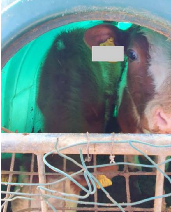
Werknummer [redacted] Vuile onderbuik en poten. Kalveren van een half jaar, veel te krappe behuizing. Geen voer en geen water beschikbaar.