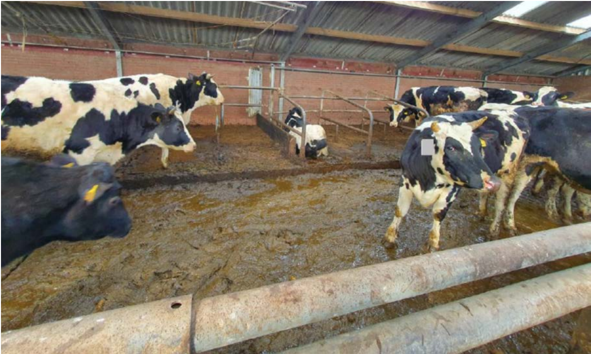
Bijlage 6: Bevindingen donderdag 8 april 2021