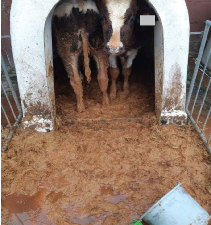
Kalveren zonder schone en droge ligplaats.