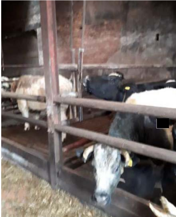
Overzichtsfoto's stierenstal. Alleen varkensdrinkknippen, 1 per hok.