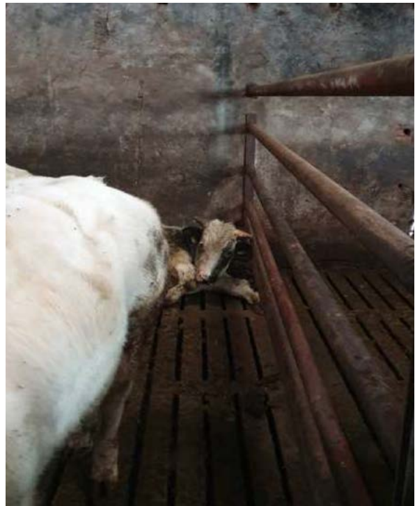
Rund lijkt ziek of gewond en niet afgezonderd.