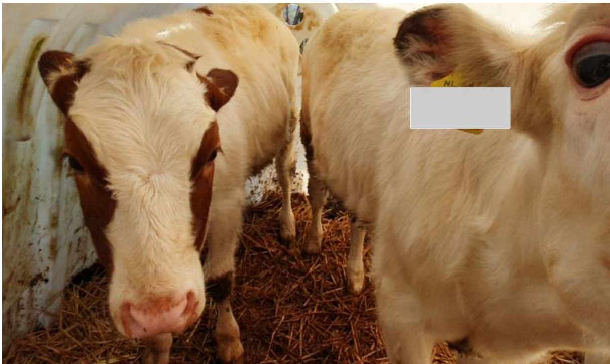
Werknummers [redacted] vuil nat strooisel. Vuile onderbuik en poten. Kalveren van bijna een half jaar, veel te krappe behuizing. Geen voer en geen water beschikbaar.