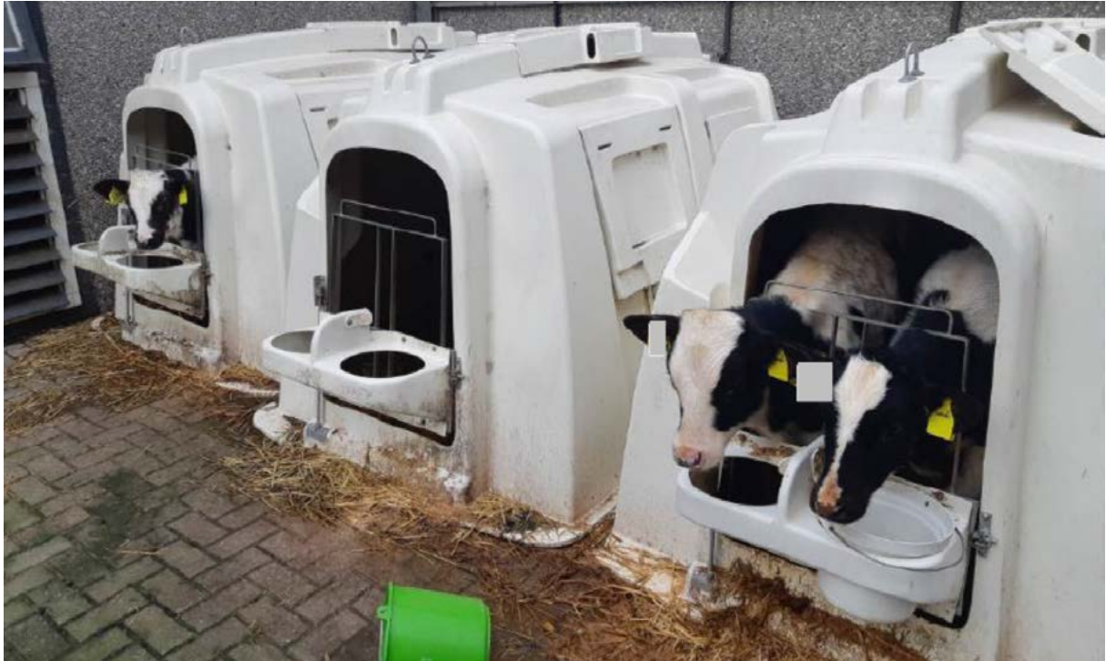
Kalveren zonder drinkwater.